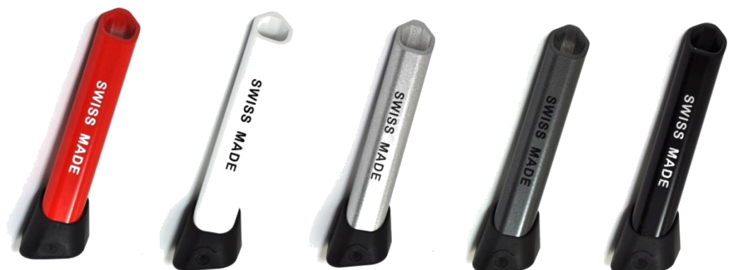
Hülsen und F18