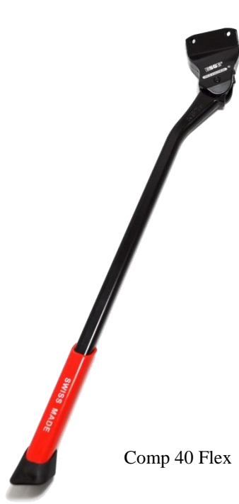
Comp 40 Flex